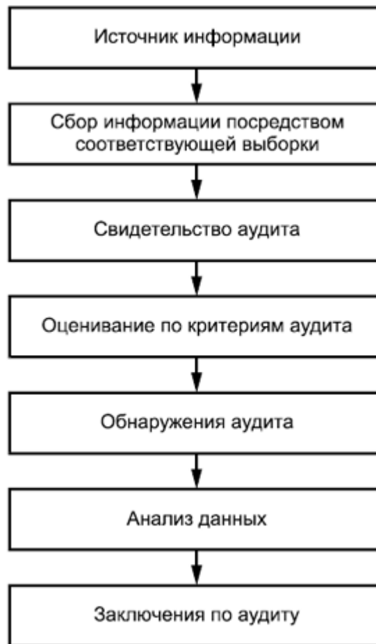
Рисунок 2 - Обзор типового процесса сбора и проверки данных Методы сбора информации включают, но не ограничиваясь, следующее: